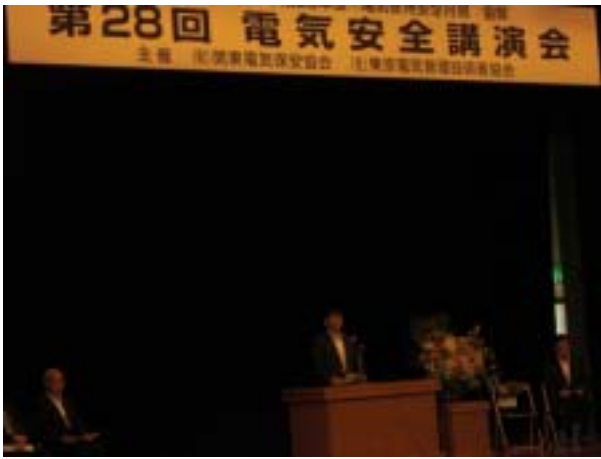
名久井産業保安監督部長挨拶